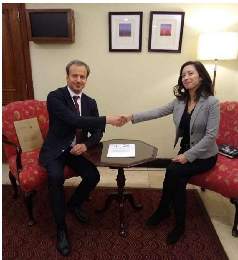
Arkady Dvorkovich (FIDE President) and Damaris Abarca (AJEFECH President) – 07/29/2019

The project was established during the visit to Chile of FIDE President Arkady Dvorkovich during the month of July 2019, where different meetings were held in conjunction with the Board of the Chilean Chess Federation with organizations of the Government of Chile related to sport and culture.