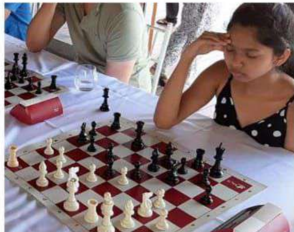
■ La joueuse d'échecs a été la meilleure féminine à l'Océan Villas Open en octobre 2020.