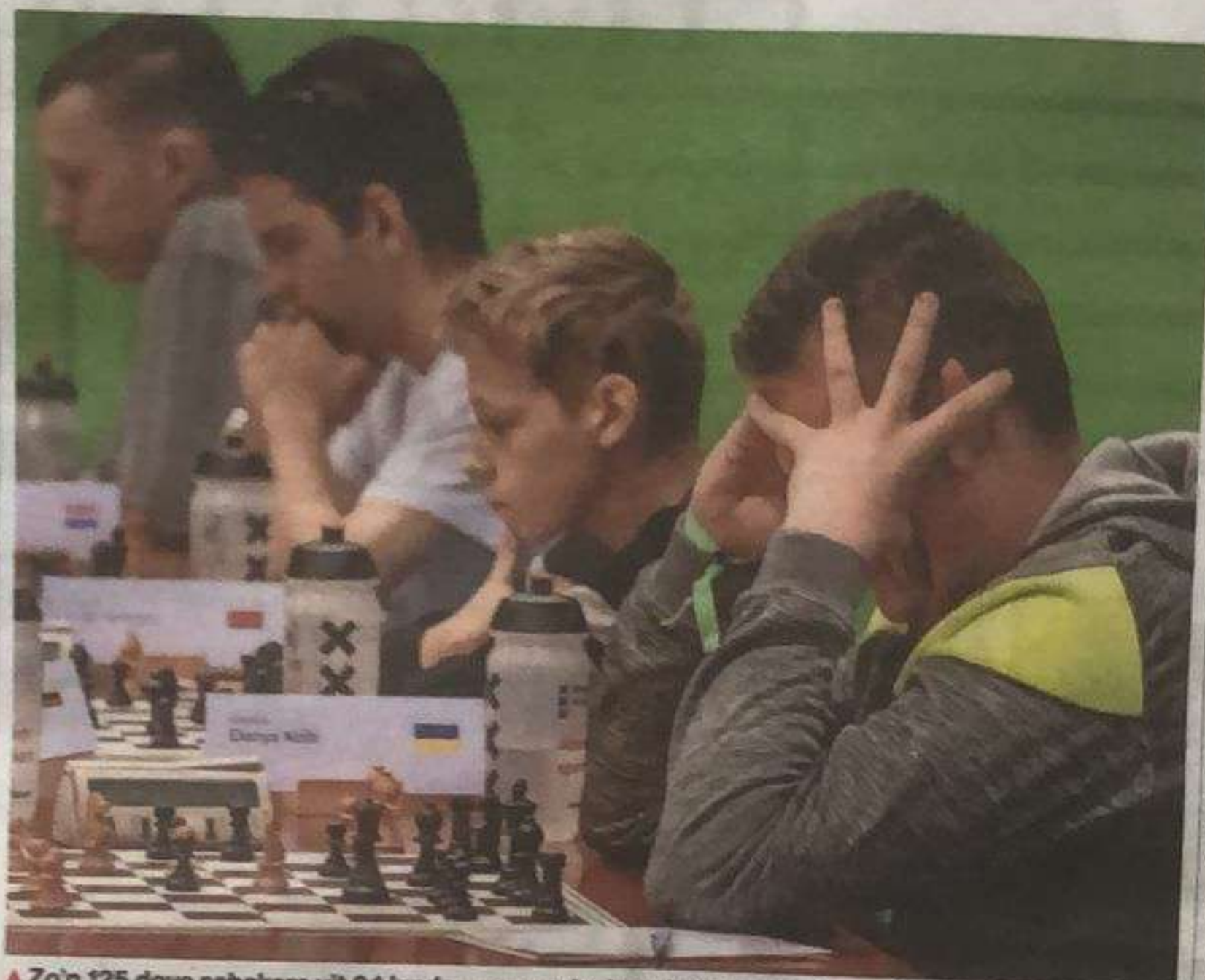
▲ Zo'n 125 dove schakers uit 24 landen nemen deel aan het EK voor dove schakers.

Bij het Europees kampioenschap schaken voor doven, dat deze week gehouden wordt in Sportcentrum Bijlmer, wordt op het scherp van de Bijlmer, wordt op het scherp van de mede gespeeld. Zo'n 125 schakers met een gehoorverlies van minimaal 55 decibel, afkomstig uit 24 verschil-