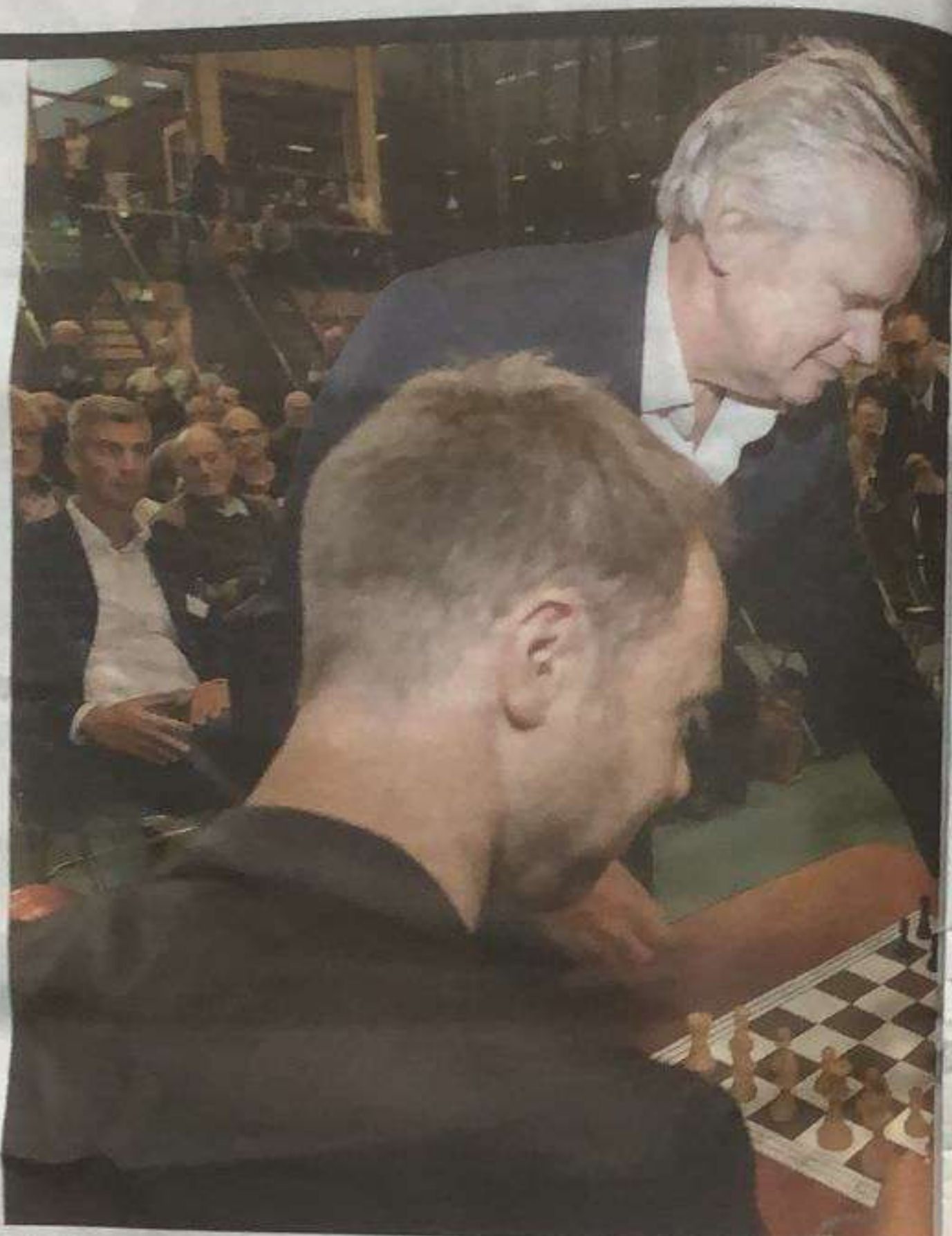
Zuidoost EK Schaken voor doven