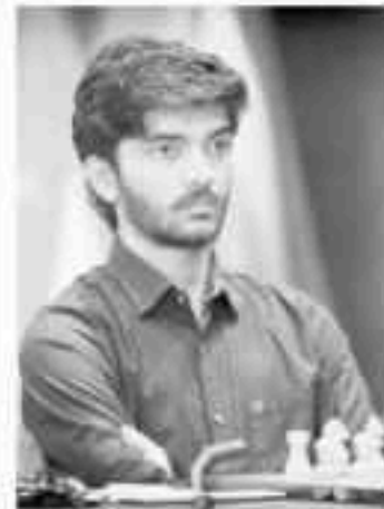
GM Gukesh D (အိန္ဒိယ)

တစ်နိုင်ငံတည်းသား သူငယ်ချင်းအတွက် လက်စားချေခဲ့သူက အိန္ဒိယစူပါ ဂရင်းမာစတာ GM Vidit Santosh Gujrathi ပဲ ဖြစ်ပါတယ်။ GM Nepomniachtchi Ian ကို ပုံမှန်နှစ်ပွဲ၊ သရေပြတ်နှစ်ပွဲ စုစုပေါင်း လေးပွဲဆက်တိုက် သရေကျပြီးတဲ့နောက် ဆက်ကစားရတဲ့ သရေပြတ်ပွဲနှစ်ပွဲစလုံး အနိုင်ကစားပြီး ပြတ်ပြတ်သားသား အောင်ပွဲခံခဲ့တာပါ။