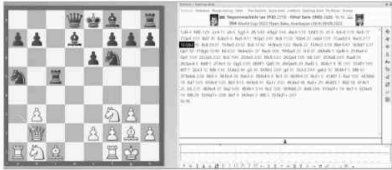
GM Nepomniachtchi, Ian & GM Nihal Sarin ပထမပွဲ။