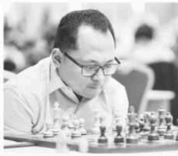
GM Paragua Mark (ဇီလန်)