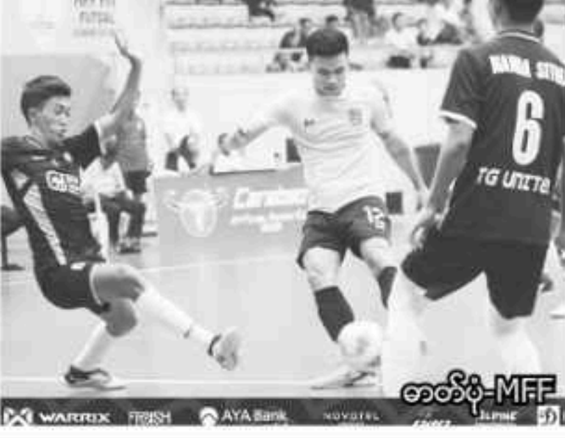
အာရှဖူဆယ်ချန်ပီယံရှစ် ခြေစမ်းပွဲအတွက် ကြိုတင်ပြင်ဆင်မှုအနေဖြင့် ပဏာမမြန်မာ့လက်ရွေးစင်ဖူဆယ်အသင်းသည် မန္တလေးမြို့ အခြေစိုက်ဖူဆယ်အသင်းဖြစ်သည့် TG ယူနိုက်တက်အသင်းနှင့် ခြေစမ်းကစားခဲ့ရာ နှစ်ပွဲစလုံး အနိုင်ရရှိခဲ့ကြောင်း သိရသည်။

လူတလူ၊ ရန်ကုန်၊ စက်တင်ဘာ-၈ အာရှဖူဆယ်ချန်ပီယံရှစ် ခြေစမ်းပွဲအတွက် ကြိုတင်ပြင်ဆင်မှုအနေဖြင့် ပဏာမမြန်မာ့လက်ရွေးစင်ဖူဆယ်အသင်းသည် မန္တလေးမြို့ အခြေစိုက်ဖူဆယ်အသင်းဖြစ်သည့် TG ယူနိုက်တက်အသင်းနှင့် ခြေစမ်းကစားခဲ့ရာ နှစ်ပွဲစလုံး အနိုင်ရရှိခဲ့ကြောင်း သိရသည်။ ပဏာမမြန်မာ့လက်ရွေးစင်ဖူဆယ်အသင်းသည် စက်တင်ဘာ ၅ ရက်တွင် TG ယူနိုက်တက်