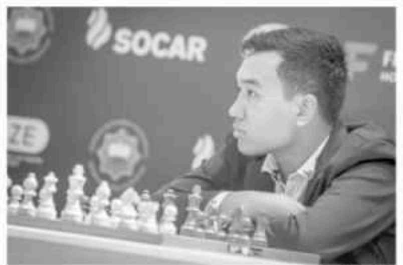
နေလင်းထွန်း။

အာရှတိုက်ကြီးတစ်ခုလုံးအတွက်မှ ခွဲတမ်းနေရာ ၂၀ သာရှိတာကို တွေ့နိုင်ပါတယ်။ ဇန်အမှတ် 3.3 မှာ အာဆီယံနိုင်ငံတွေအပြင် Chinese Taipei, Hong Kong, Japan, Korea, Macau, Mongolia တို့ပါဝင်ပြီး စုစုပေါင်း ၁၇ နိုင်ငံရှိပါတယ်။ ဇန်အမှတ် 3.3 အတွက် ကမ္ဘာ့ဖလားမှာ အမျိုးသား နှစ်နေရာ၊ အမျိုးသမီး တစ်နေရာ ခွင့်ပြုထားပါတယ်။ စစ်တုရင်အင်အားကြီးနိုင်ငံတွေဖြစ်တဲ့ ဗီယက်နမ်၊ အင်ဒိုနီးရှား၊ ဖိလစ်ပိုင်၊ စင်ကာပူ၊ မွန်ဂိုလီးယားတို့ပါဝင်နေပြီး ဗီယက်နမ်ဆိုရင် ကမ္ဘာ့လှုပ်တစ်ပြက် ချန်ပီယံတောင်မှ မွေးထုတ်နိုင်တဲ့နိုင်ငံဖြစ်ပါတယ်။ စူပါဂရင်းမာစတာတွေ အများအပြားရှိတဲ့ ဒေသဖြစ်တာကြောင့် ဇန်ပြိုင်ပွဲအနိုင်ရပြီး လက်ရည်စစ်အောင်ဖို့က မလွယ်ခဲအောင်အားလုံး ဆိုရမလို့ပါ။