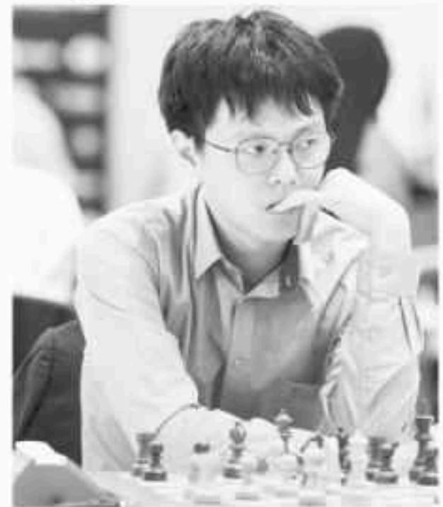
FM Lim Zhuo Ren (မလေးရှား)

မိတ်ဆွေတစ်ဦးက "မင်းတပည့်လေး တွေ အပေါ်ရောက်လာမှာပေါ့လေ" ဆို တော့ ပြောနေပါသတဲ့။