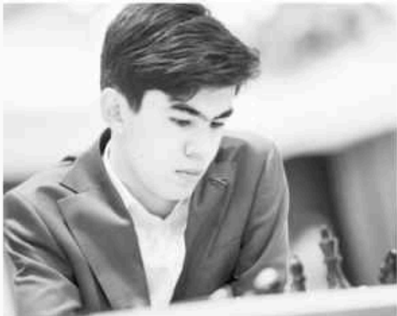
GM Javokhir Sindarov

အလယ်တည့်တည့်မှာ နေရာချထားပြီးတဲ့ နောက် ဘစ်ရှော့ကို e7 ကို ရွှေ့ခဲ့ပါတယ်။ (စစ်တုရင်ကစားသမား တစ်ယောက်ဟာ ကိုယ့်ကစားကောင်တွေကို သပ်သပ်ရပ်ရပ် ဖြစ်အောင် ညှိချင်၊ နေရာချချင်ရင် ကိုယ့်ရဲ့ ရွှေလှည့်မှာသာ လုပ်ကိုင်ခွင့်ရှိပြီး ကိုယ့်ရဲ့ ရည်ရွယ်ချက်ဖြစ်တဲ့ အရပ်ညီမယ်ဆိုတဲ့ အကြောင်းကို Iadjust သို့မဟုတ် J'adobe သို့မဟုတ် ကစားသမားနှစ်ယောက်စလုံး နားလည်တဲ့ ဘာသာစကားနဲ့ပြောဆိုအသိပေးပြီးမှ လုပ်ရပါတယ်။) အဲဒီရွှေ့ကွက် ပြီးပြီးချင်းမှာ GM Nepomniachtchi က ဒိုင်ကိုခေါ်ပြီး သူ့ပြိုင်ဘက်က ကိုင်တောင်မ