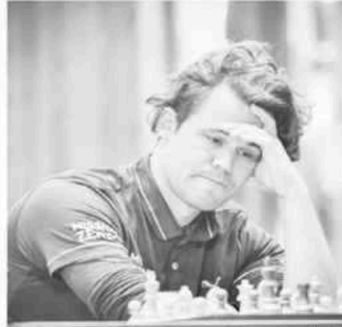
GM Magnus Carlsen (နော်ဝေ)