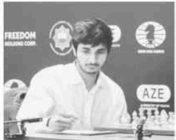
GM Vidit Santosh Gujrathi (အိန္ဒိယ)

တစ်နိုင်ငံတည်းသား သူငယ်ချင်း အတွက် လက်စားချေခဲ့သူက အိန္ဒိယစူပါ ဂရင်းမာစတာ GM Vidit Santosh Gujrathi ပဲဖြစ်ပါတယ်။ GM Nepomniachtchi Ian ကို ပုံမှန်နှစ်ပွဲ၊ သရေပြတ်နှစ်ပွဲ စုစုပေါင်း လေးပွဲဆက်တိုက် သရေကျပြီးတဲ့နောက် ဆက်ကစားရတဲ့ သရေပြတ်ပွဲနှစ်ပွဲစလုံး အနိုင်ကစားပြီး ပြတ်ပြတ်သားသား အောင် ပွဲခံခဲ့တာပါ။