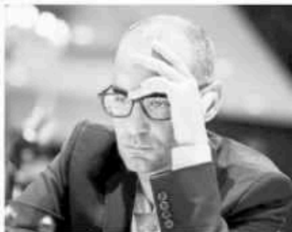
GM Dominguez Perez Leinier (အမေရိကန်)