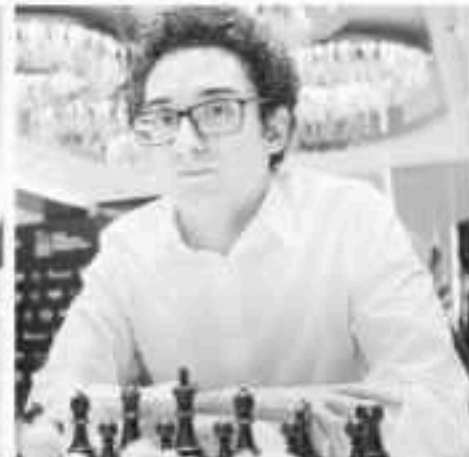
GM Caruana Fabiano (အမေရိကန်)