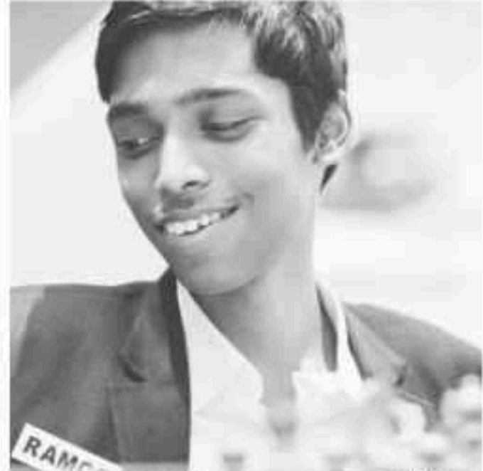
GM Pragganandhaa R (အိန္ဒိယ)

တစ်ပွဲသရေရဲ့ အနိုင်ယူပြီး ဆီမီးဖိုင်နယ်ကို တက်လွှမ်းခဲ့ပါတယ်။ GM Gukesh D နဲ့ တွဲပွဲဟာ ဘာမှ မည်မည်ရရ အမှားလုပ်ခဲ့