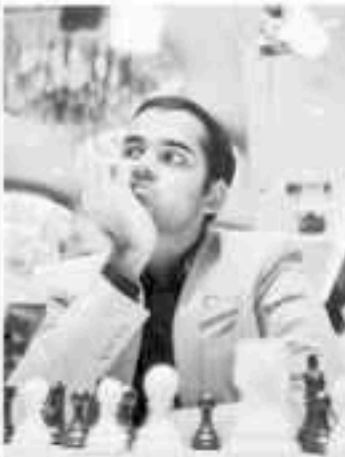
GM Erigaisi Arjun (အိန္ဒိယ)