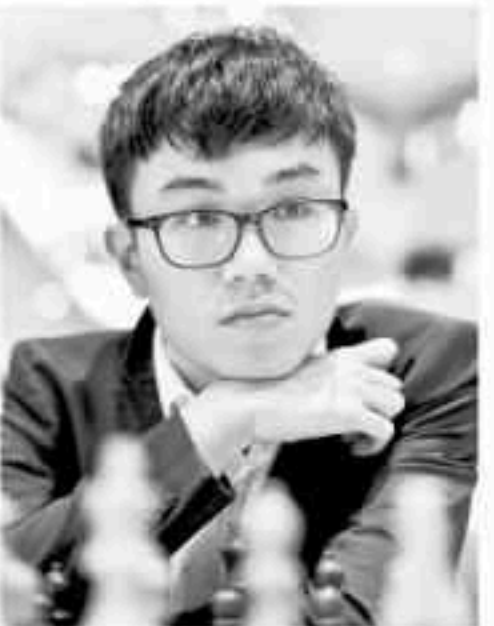
GM Tin Jingyao (စင်ကာပူ)