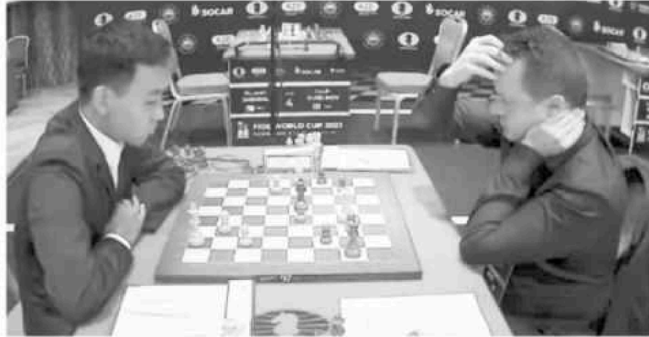
CM နေလင်းထွန်း (မြန်မာ) (ဝဲ) ပထမပွဲယှဉ်ပြိုင်ကစားစဉ်။