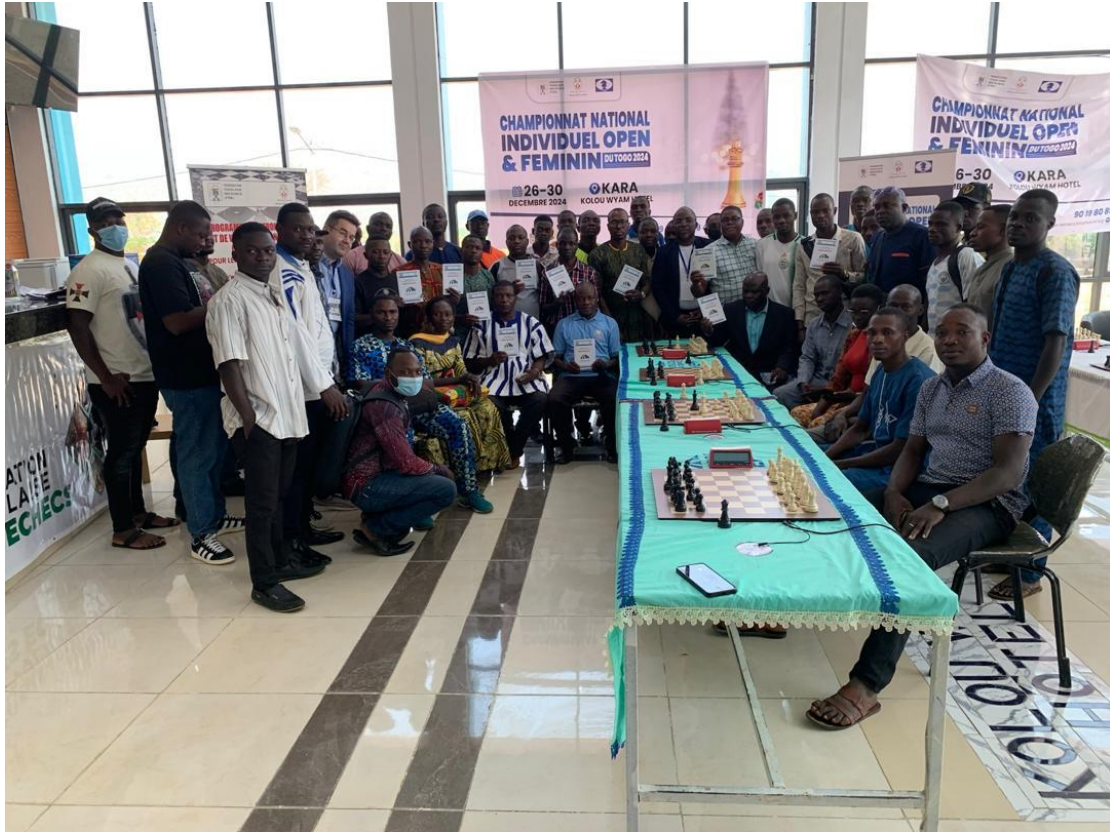
HANDOVER OF MATERIALS TO SCHOOL TEACHERS/PIVE