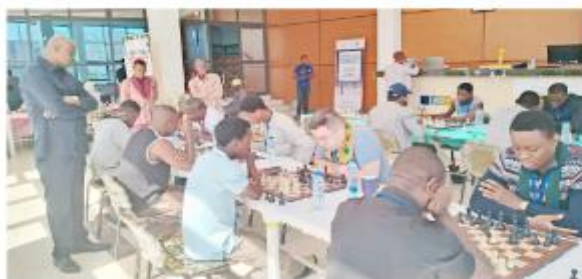
Une phase de jeu lors de la ronde 1.

Le championnat national individuel open et féminin du jeu d'échecs a été ouvert jeudi dans la Kozah et plus précisément à Kolou Wyam Hôtel où les challenges ont débuté vendredi. La compétition étalée du 26 au 30 décembre avec 14 hommes et 11 dames, réserve d'allechantes récompenses aux cinq meilleurs des deux versions. Le protocole de la cérémonie d'ouverture, riche en chants et danses traditionnels, a été observée la veille, en présence des autorités de la préfecture, communales, sportives ainsi que du président de la Fédération Togolaise des Echecs (FTDE), Me. N'djellé Abby Edah.