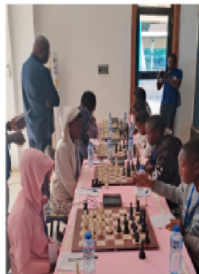
Le jeu d'échecs, un moment de concentration accrue.

Ce couronnement, a estimé la championne Kponsou, symbolise avant tout, un travail acharné et une stratégie bien pensée face à des adversaires aussi redoutables. Pour