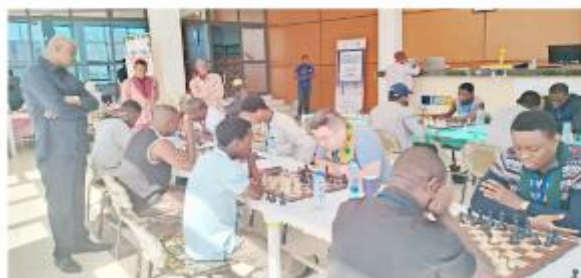
Une phase de jeu lors de la ronde 1.

Le championnat national individuel open et féminin du jeu d'échecs a été ouvert jeudi dans la Kozah et plus précisément à Kolou Wyam Hôtel où les challenges ont débuté vendredi. La compétition étalée du 26 au 30 décembre avec 14 hommes et 11 dames, réserve d'alléchantes récompenses aux cinq meilleurs des deux versions. Le protocole de la cérémonie d'ouverture, riche en chants et danses traditionnels, a été observée la veille, en présence des autorités de la préfecture, communales, sportives ainsi que du président de la Fédération Togolaise des Echecs (FTDE), Me. N'djellé Abby Edah.