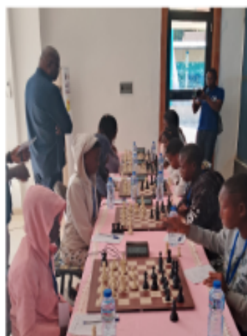
Le jeu d'échecs, un moment de concentration accrue.

Ce couronnement, a estimé la championne Kponsou, symbolise avant tout, un travail acharné et une stratégie bien pensée face à des adversaires aussi redoutables. Pour