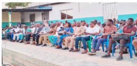
Diverses autorités locales et responsables d'établissements scolaires à l'ouverture du championnat national des échecs.

Après novembre 2023 à Atakpamé, la Fédération Togolaise des Echecs, fidèle à sa politique de délocalisation et de vulgarisation de la discipline, a choisi la Kozah cette année pour abriter l'édition 2024 du championnat national individuel open et féminin du jeu d'échecs. Cette compétition à 7 rounds avec une